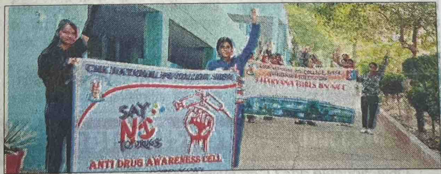
सीएमके नेशनल स्नातकोत्तर महाविद्यालय में रैली निकालते विद्यार्थी।