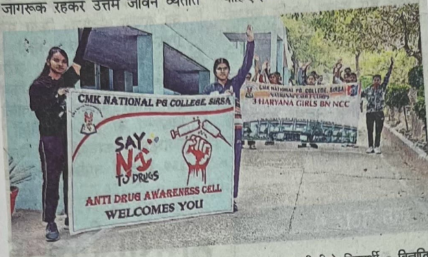
सीएमके कालेज में नशे के प्रति जागरूकता रैली निकालते एनसीसी के विद्यार्थी • विज्ञापित