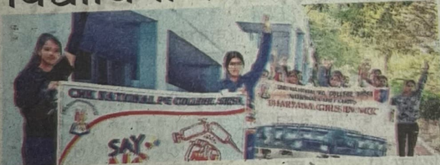
रैली निकालते विद्यार्थी।

सिरसा, 24 दिसंबर(स.ह) : सी.एम.के. नेशनल स्नातकोत्तर महाविद्यालय में एन.सी.सी. विद्यार्थियों द्वारा नशे की रोकथाम व जागरूकता अभियान के अंतर्गत एक रैली निकाली जिसमें उन्होंने आमजन को नशे से मुक्त रहने का संदेश दिया।