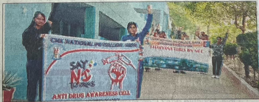
सीएमके नेशनल स्नातकोत्तर महाविद्यालय में रैली निकालते विद्यार्थी।