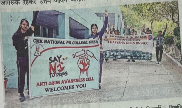
सीएमके कालेज में नशे के प्रति जागरूकता रैली निकालते एनसीसी के विद्यार्थी • विज्ञापित